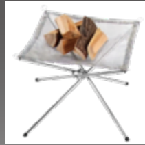
【別売り】 UJack(ユージャック) メッシュファイアスタンド 焚火台