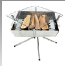
【別売り】 UJack(ユージャック) ファイアグリル バーベキューコンロ