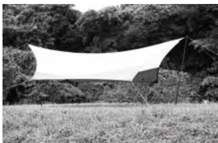
ウイングタープでの使用イメージ(2本使用した場合)

通常のタープポールやキャンピーポールと同様に設営してください。長さを決めたら、各ロックナットがしっかり締まっているか下側から順に確認してから設営を始めてください。安全のため、お使いになるタープ、テントの説明書にある使用方法で正しく安全に使用してください。