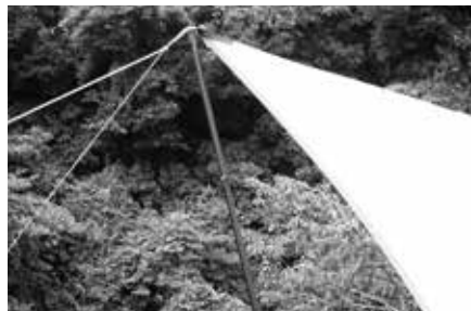
タープのグロメットにヘッドピンを通し、その上にガイロープをかけペグダウンしてください。

カーボン素材は、軽く強靱な特性を備えますが、限界を越えてしまわないために、初めから反りなどが生じている、ぐらぐらしているなどの無理やゆるみがないように適度なテンションで設営してください。ポールという構造上横方向への衝撃には弱いので、物を載せたり、踏みつけなどにも注意してください。